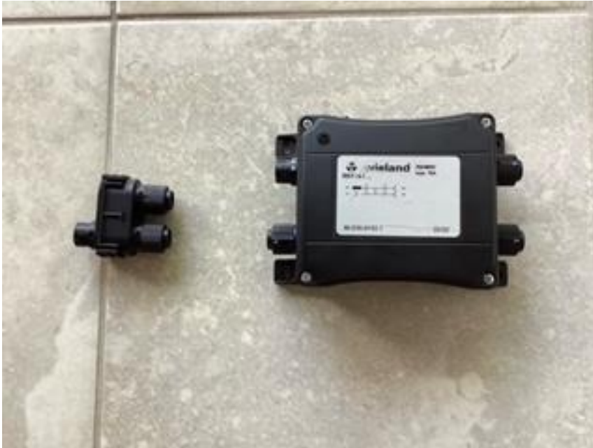
Abbildung 1: Links Wieland-Verteiler für zwei Wechselrichter (Y-Verbinder), rechts Wieland-Verteiler für drei Wechselrichter